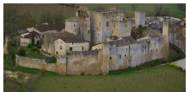
Château du Moyen-Age