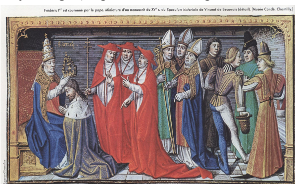
Peinture du Moyen-Age

Exercice 3 : Explique en quelques lignes pourquoi l'art de la Renaissance était différent de celui du Moyen-Age (en peinture, en sculpture et en architecture).