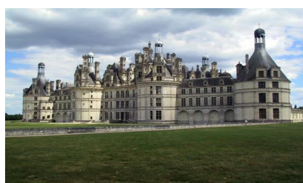
Château de la Renaissance